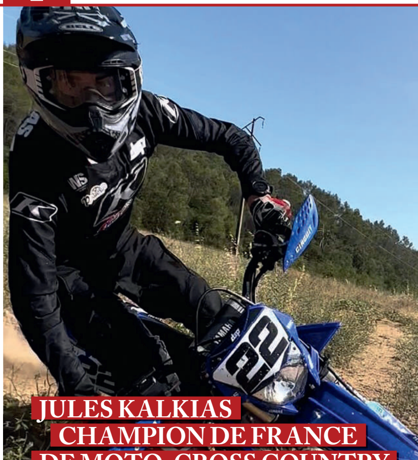
JULES KALKIAS CHAMPION DE FRANCE DE MOTO-CROSS COUNTRY